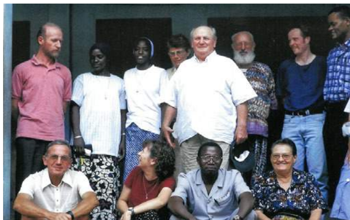
Les équipes apostoliques des paroisses à Salémata, Ourous et Koundara

sécheresse, qui n'étaient pas incitatives pour les jeunes chez eux. Plusieurs ont pu accompagner bon nombre de personnes de leurs villages en migration vers le fleuve Gambie pour retravailler, et se réinstaller. A cause de la sécheresse aussi, nous avons dû quitter Bambey en 1978. C'est alors que le centre a été repris par la Caritas de Thiès, qui avait lancé une opération de forage plus au sud. Ils ont utilisé le centre pour faire faire des stages aux gens des environs de ces forages, et pour y faire du maraîchage et des petits élevages.