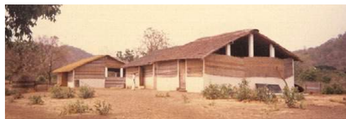
Centre de formation au développement agricole de Salémata construit grâce aux dons de Misereor, œuvre gérée par l'Église catholique en Allemagne.

Dans les années 70, nous avons été bloqués dans ce travail de formation par plusieurs années de grande