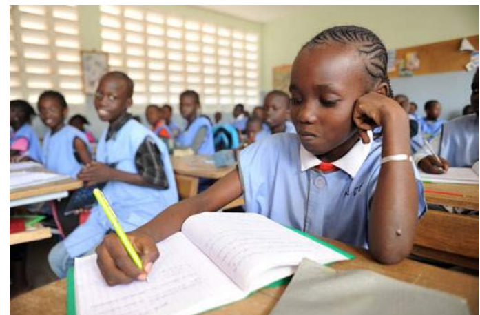
Les enfants de l'école à Malika