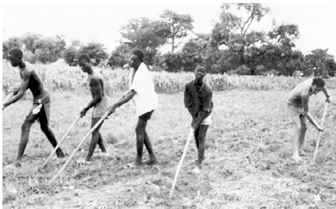
A Bambey, les jeunes qui travaillaient avaient une devise : «la joie et les chants»