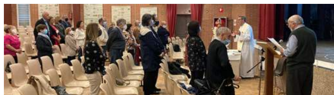
Célébration eucharistique - AGMONT - Barcelone