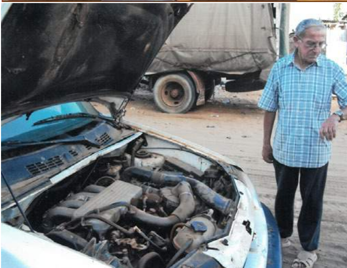
... voiture en panne à Malika... il faut un peu de temps pour attendre la réparation... La patience est de rigueur !!!