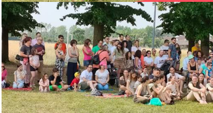
Les 4 et 5 juin, nous avons eu une cérémonie de clôture annuelle d'environ 400 étudiants en danse. Ce furent de merveilleuses journées de danse pour les élèves, leurs professeurs et leurs parents. Le programme s'est déroulé à l'extérieur dans les prés et la spectaculaire allée de tilleuls.