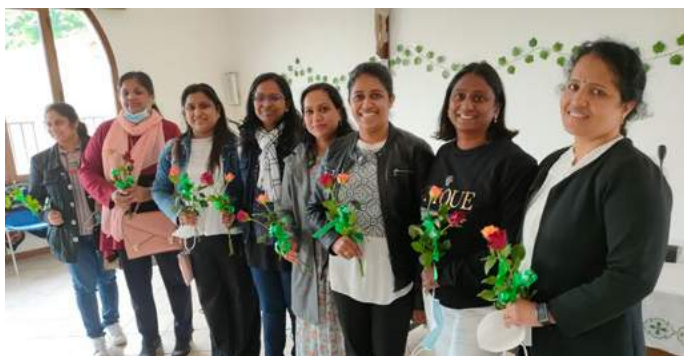
La communauté indienne catholique syro-malabar célèbre régulièrement une messe dans notre Institution. Ils ont également célébré la fête des mères.