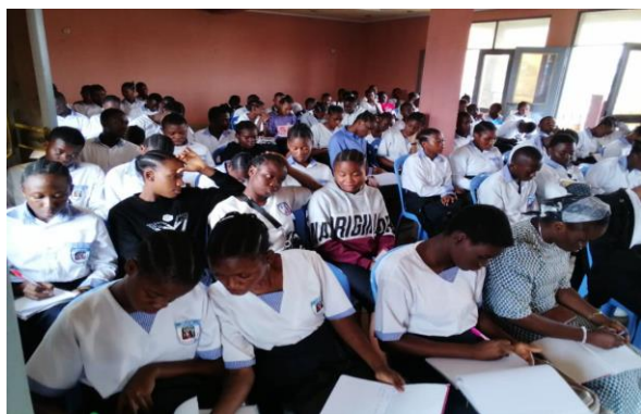
Les élèves en plaine conférence

Cette messe avait pour but de confier l'année, les activités, les apprenants et tous les