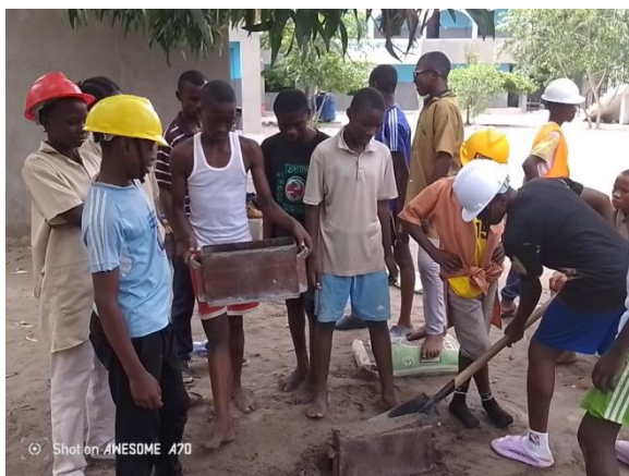
Les élèves de construction ont fabriqué des briques et la construction de la paillasse du laboratoire.

Pour ce qui est de réalisation des élèves à la première période, plusieurs travaux ont été réalisés dans la quasi-totalité des options organisées au collège.