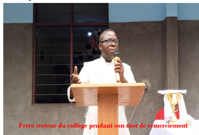
Frère recteur du collège pendant son mot de remerciement

lumière du monde en milieu scolaire, il a prié pour que l'année soit couronnée des succès et a rappelé les trois principes fondamentaux de l'éducation.