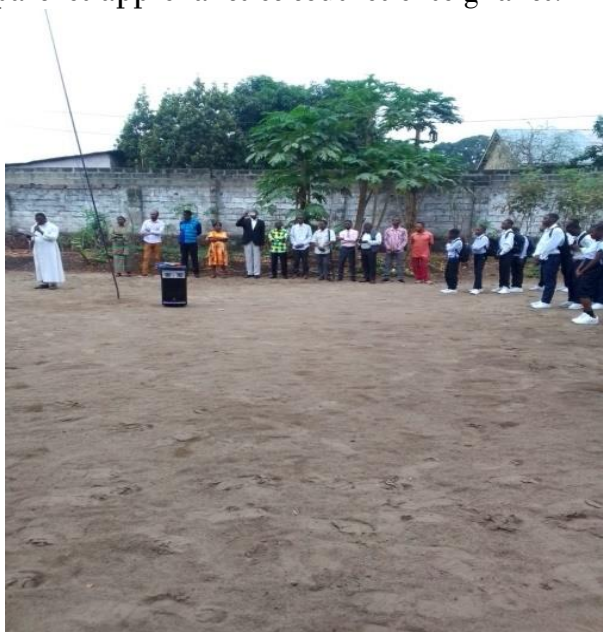
Photo de la rentrée et présentation des éducateurs

La messe du Saint Esprit a été dite le vendredi 4 Octobre 2024 en la Paroisse Saint Alphonse par Monsieur l'Abbé curé, à laquelle ont pris part les apprenants et tous les enseignants.