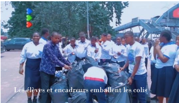
Les élèves et encadreurs emballent les colis

Le but de cette journée est de lutter contre la pollution urbaine et encourager le zéro déchet. La journée a débuté par la sensibilisation des