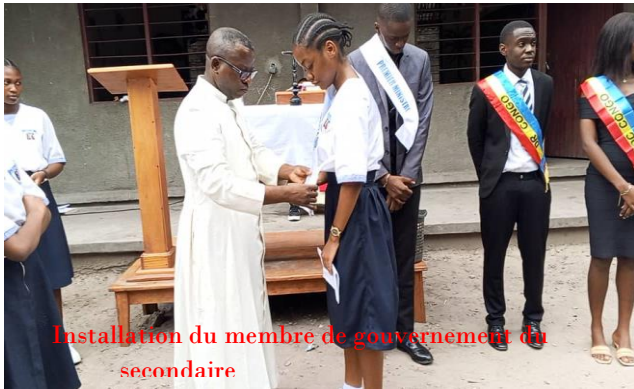
Installation du membre de gouvernement du secondaire

A la fin de la célébration eucharistique, les responsables d'écoles ont procédé à l'installation des membres de deux gouvernements, celui du primaire et du secondaire.