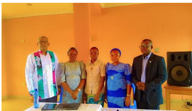
Photos souvenir avec les religieuses

Dans son homélie, le prêtre a exhorté les élèves et les personnels à être le sel de la terre et la