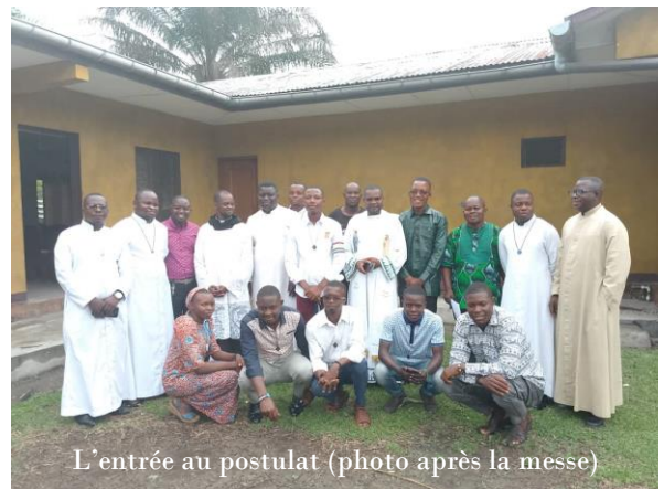
L'entrée au postulat (photo après la messe)