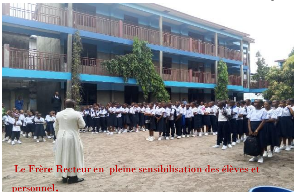
Le Frère Recteur en pleine sensibilisation des élèves et personnel.

Ensuite les élèves ont procédé toute la matinée à nettoyer les salles de classes, la cour de l'école, les caniveaux à l'entrée du Collège et à