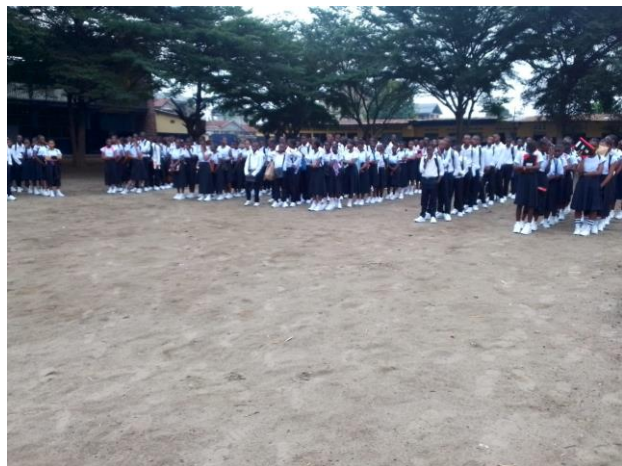
Photo de la rentrée scolaire Collège St Alphonse

Le 30 Août 2024, il s'est tenue la réunion préparatoire. Les cinq points ayant fait l'objet de cette première rencontre sont : les activités spirituelles, l'administration, la pédagogie, les finances et la discipline.